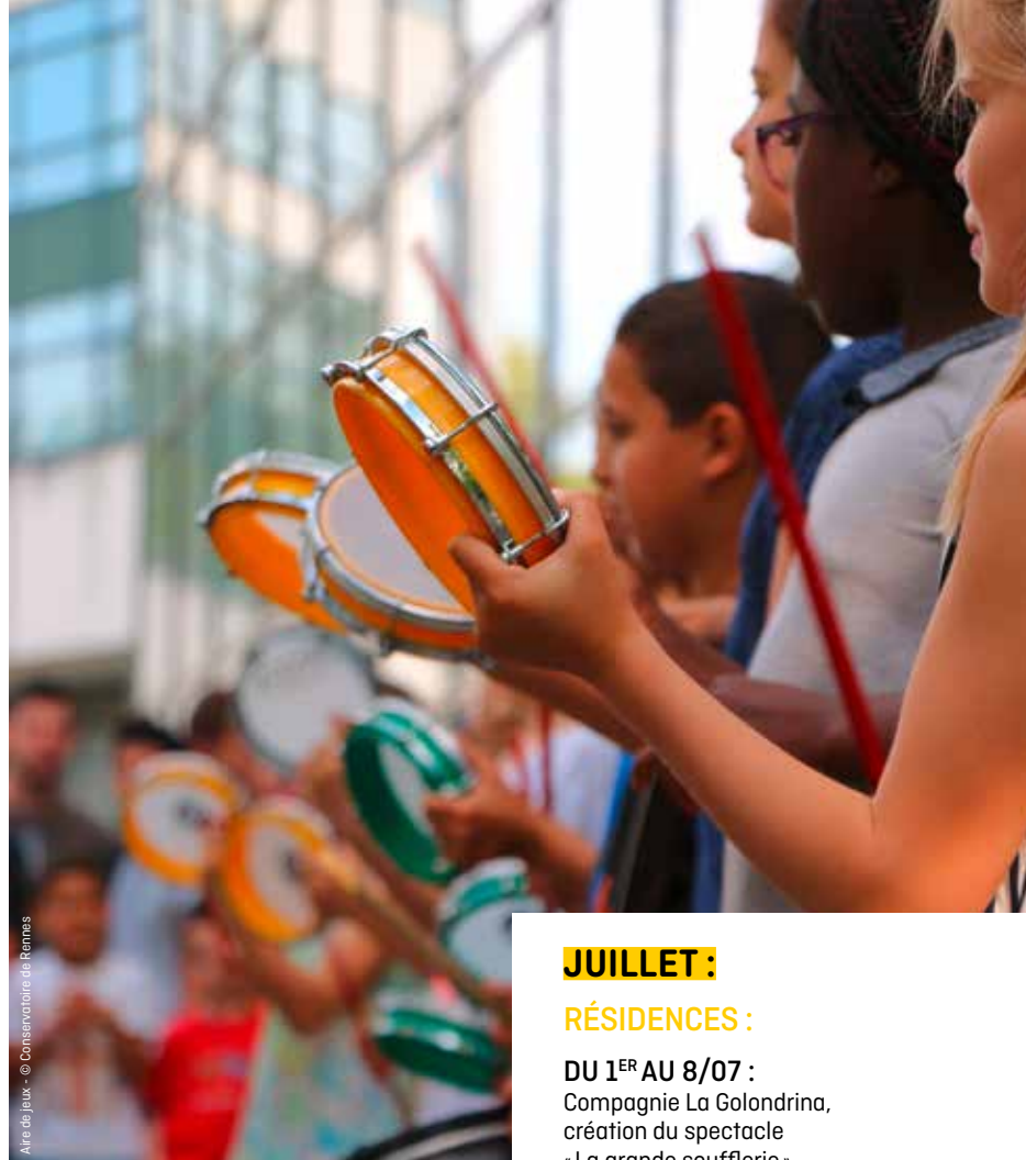
Air de jeux

DU 20 AU 26/06 : Compagnie Les cris de Vénus, création du spectacle « Traffic »